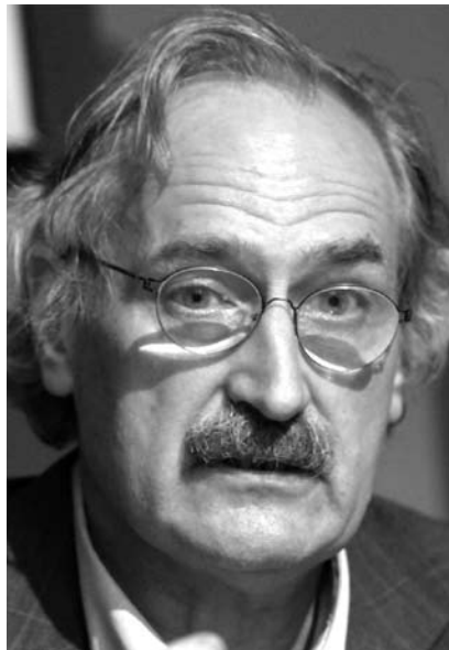
Axel Honneth ist Professor für Sozialphilosophie an der Goethe-Universität Frankfurt/Main und Direktor des Instituts für Sozialforschung.

Der Meister: Axel Honneth, geb. 1949 in Essen, studierte Philosophie, Soziologie und Germanistik in Bonn, Bochum und Berlin. Nach Professuren an der Universität Konstanz und der FU Berlin ist er heute Professor für Sozialphilosophie an der Goethe-Universität und Direktor des Instituts für Sozialforschung in Frankfurt/Main. Axel Honneth gilt als einer