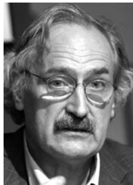
Axel Honneth ist Professor für Sozialphilosophie an der Goethe-Universität Frankfurt/Main und Direktor des Instituts für Sozialforschung.