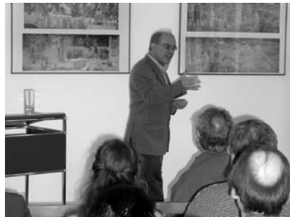
Vittorio Höhle entwickelt einen Gedankengang im Vortragsraum des fiph.

Am 01. März 2010 war Vittorio Höhle, Professor für Philosophie an der Notre Dame University (USA) und einer der bekanntesten deutschen Philosophen, am fiph mit einem Vortrag zu Gast.